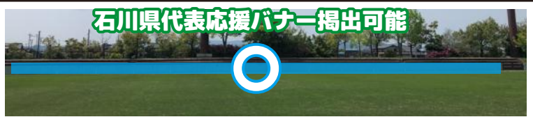
石川県代表応援バナー掲出可能