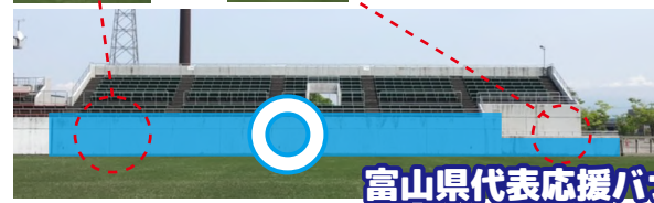
富山県代表応援バナー掲出可能