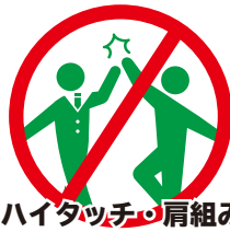
ハイタッチ・肩組み