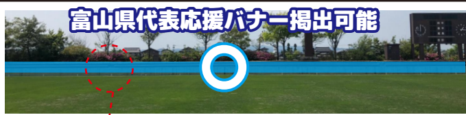
富山県代表応援バナー掲出可能