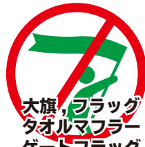
大旗、フラッグ タオルマフラー ゲートフラッグ 「振る」「回す」