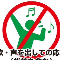
歌・声を出しての応援 (指笛も含む)