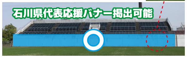
石川県代表応援バナー掲出可能