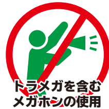
ドラメガを含む メガホンの使用

手拍子やタオルマフラーを掲げての応援は可能です。 お客様の手拍子の扇動の為の太鼓の使用は可能です。 タオルマフラーを掲げる際には、周りのお客様の観戦の妨げになる行為はご遠慮ください。